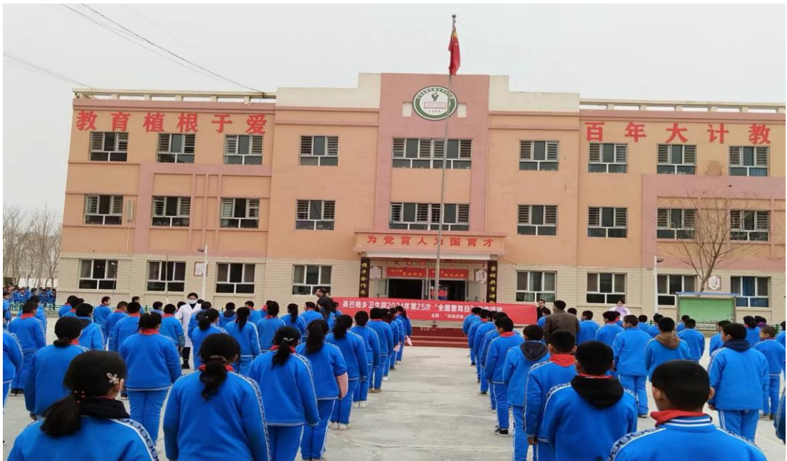
专家深入中小学校开展宣传