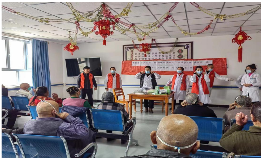
专家深入养老机构开展宣传

三、发放宣传单。 各医疗机构在宣传义诊时，向群众发放有关听力保护与耳部健康的宣传手册和宣传单，方便各族人民群众随时查阅和学习，切实提高群众的爱耳、护耳意识，此次活动发放宣传材料1万余份。