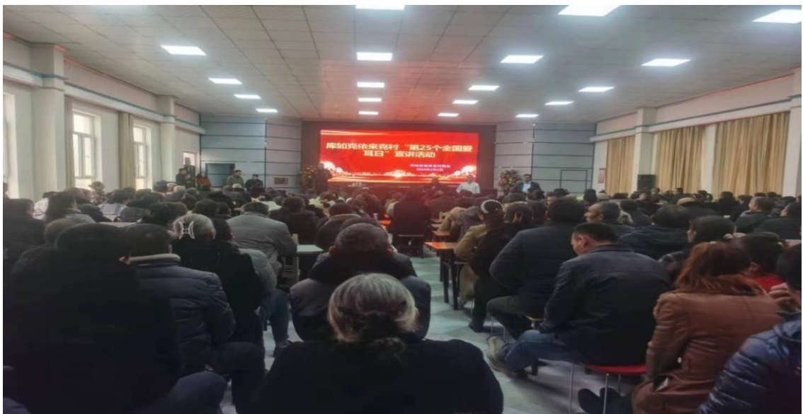
专家深入农村开展宣传

二、深入基层开展宣传。 各医疗机构耳科相关专家深入农村、社区、学校、养老机构等开展宣传，重点对“听力损失的成因、预防及治疗方法、如何进行爱耳护耳的科学知识与方法”等内容，结合实际进行了深入浅出的讲解，受教人数达10余万人次。