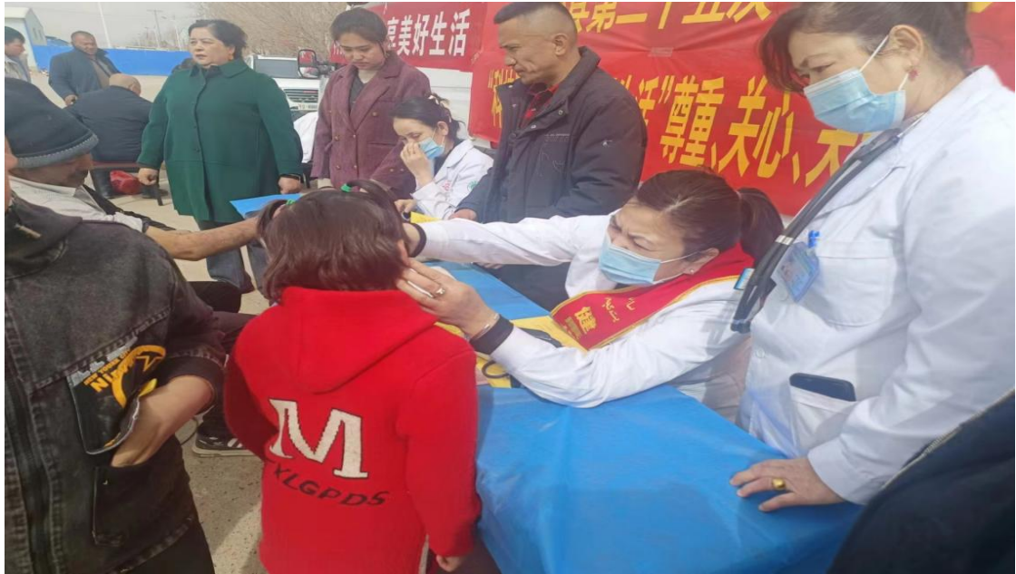
医疗机构耳科相关专家深入农村开展义诊活动

二、深入基层开展宣传。 各医疗机构耳科相关专家深入农村、社区、学校、养老机构等开展宣传，重点对“听力损失的成因、预防及治疗方法、如何进行爱耳护耳的科学知识与方法”等内容，结合实际进行了深入浅出的讲解，受教人数达10余万人次。