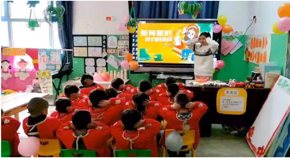
专家深入幼儿园开展宣传