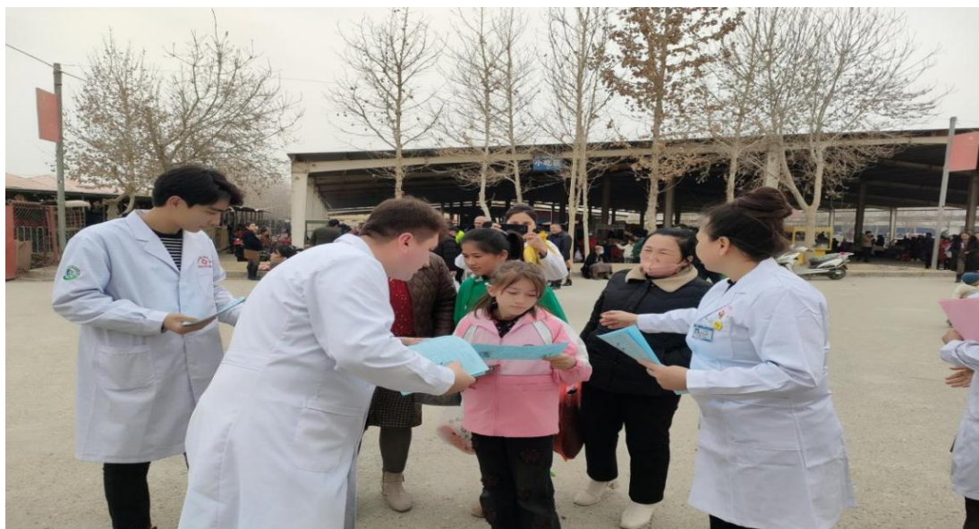
各医疗机构医务人员向群众发放宣传单

三、发放宣传单。 各医疗机构在宣传义诊时，向群众发放有关听力保护与耳部健康的宣传手册和宣传单，方便各族人民群众随时查阅和学习，切实提高群众的爱耳、护耳意识，此次活动发放宣传材料1万余份。